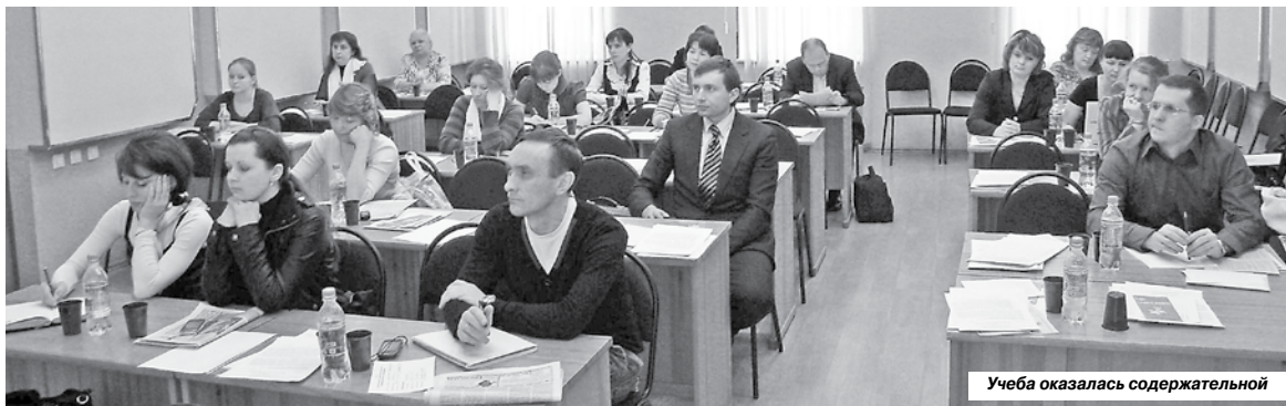
Учеба оказалась содержательной

три ставки, дежурят, совмещают и подрабатывают, чтобы обеспечить достойное существование себе и своей семье. Очень сложно мотивировать при этом их еще и на общественную работу.