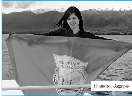
III место. «Аврора»