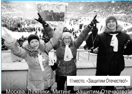
II место. «Защитим Отечество!»