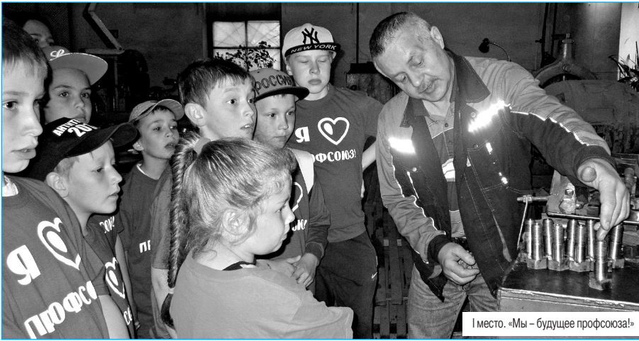
I место. «Мы – будущее профсоюза!»

Подведены итоги областного фотоконкурса Федерации профсоюзов Свердловской области «Профсоюзы и общество».