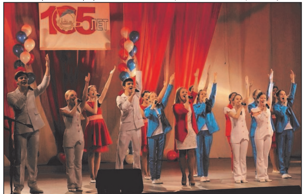
Концерт по случаю юбилея ФПСО в ДК «Современник» Североуральского ГО