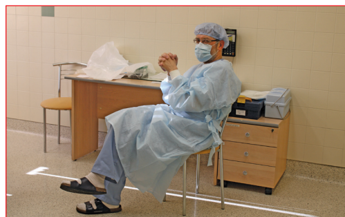
«Портрет врача». Автор – председатель профкома ОДКБ № 1 О. П. Хлебникова