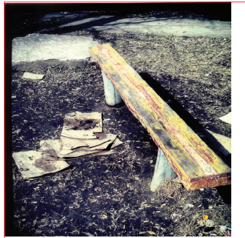
«Старая скамейка». Автор – врач ГКБ № 40 А. Э. Цориев