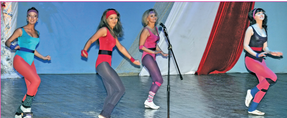
«Танцующий Первоуральск». Автор – председатель профкома Первоуральской городской стоматологической поликлиники Е.М. Юрлова