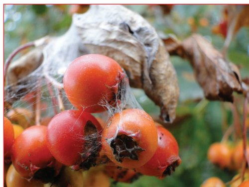
«Плоды рябины». Автор – экономист ОКБ № 1 В. В. Кобернюк