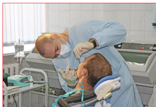
«Это совсем не больно». Автор – врач-стоматолог В. Н. Когутяк (г. Ревда)