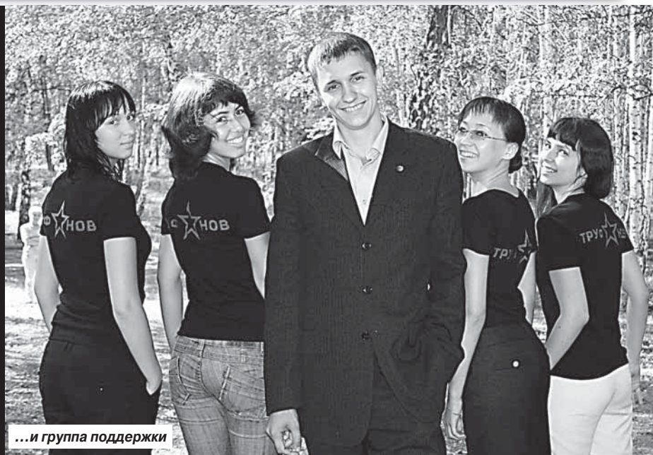
...и группа поддержки

Свыше ста профсоюзных активистов собрались на базе студенческого оздоровительного лагеря «Олимп» Южно-Уральского государственного университета на Слет студенческого актива УрФО. В его рамках проходил окружной этап Всероссийского конкурса «Студенческий лидер».