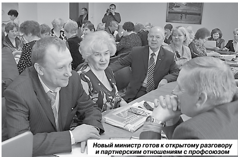
Новый министр готов к открытому разговору и партнерским отношениям с профсоюзом

В целом, по словам министра, средняя з/п работников образования вместе с вознаграждением за классное руководство составляет