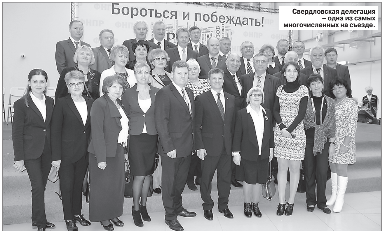
Свердловская делегация – одна из самых многочисленных на съезде.