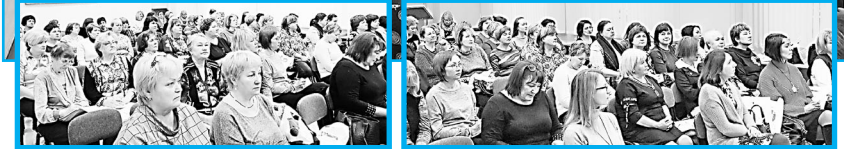
В юбилейном XX Слете профсоюзного актива женщин Свердловской области приняли участие представители более 60 женсоветов предприятий региона.