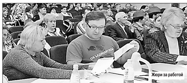
Жюри за работой