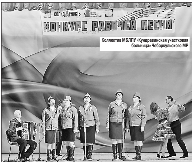
Коллектив МБЛПУ «Кундровинская участковая больница» Чебаркульского МР