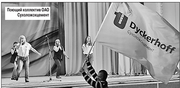
Поющий коллектив ОАО Сухоложскцемент