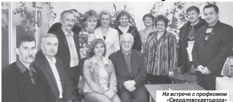
На встрече с профкомом «Свердловскавтодора»

Обком рекомендует расходовать средства на обучение, возобновление работы школ профсоюзного актива, а также на информационную политику. Сегодня эти два направления чрезвычайно