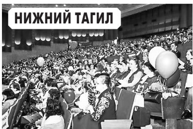
В Нижнем Тагиле 1 Мая состоялось городское торжественное собрание профсоюзных организаций, посвященное Международному Дню солидарности трудящихся.