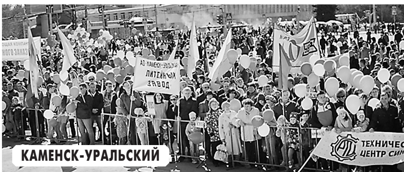
Работники Каменск-Уральского литейного завода приняли участие в городском первомайской демонстрации.