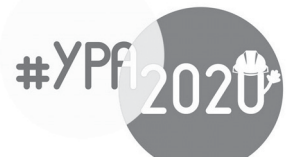
X Форум работающей молодежи Уральского федерального округа