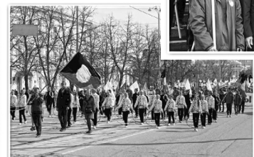
День Международной солидарности трудящихся, Праздник Весны и Труда, 1.05.2018 г.