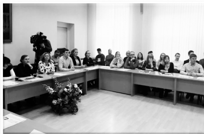
Торжественный прием «Студент года» в рамках празднования 100-летия ФПСО,