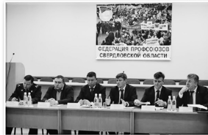
Выездное заседание Совета при Президенте РФ по развитию гражданского общества и правам человека, 28.03.2016 г.