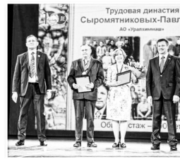
IV областной слет трудовых династий, посвященный 100-летию ФПСО, 1.06.2018 г.