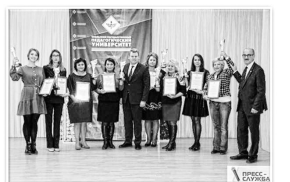
Областной семинар организаторов отдыха и оздоровления детей Свердловской области «Итоги лета - 2018», 1.11.2018 г.