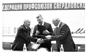
Подписание Соглашения о сотрудничестве между ФПСО и областной организацией ветеранов войны, труда, боевых действий, госслужбы, пенсионеров., 10.12.2018 г.