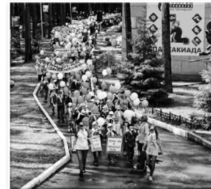
Акция «Профсоюз» в ДОЛ «Прометей», 11.07.2017 г.