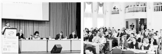
Международный форум «Инновации в профсоюзах – 2018», 22-24.06.2018 г.