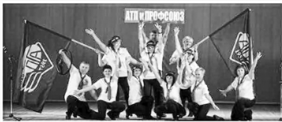
IX Всероссийский конкурс агитбригад «Профсоюзы – за достойный труд», 22.04.2017 г.