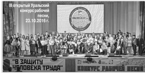
III открытый Уральский конкурс рабочей песни, 23.10.2016 г.