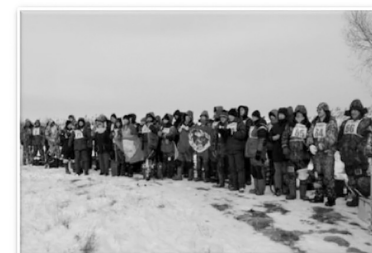
Открытый профсоюзный чемпионат Уральского федерального округа по зимней ловле рыбы на мормышку, 19.03.2018 г.