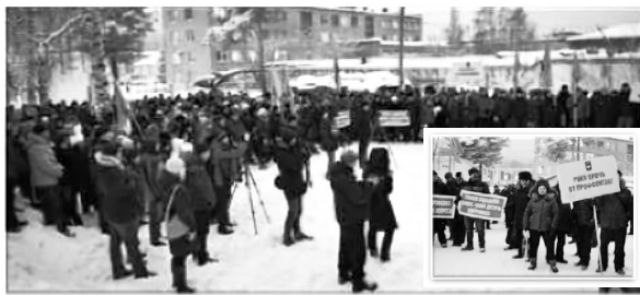
Митинг в поддержку первичной профорганизации «Качканар-Ванадий», 22.12.2015 г.