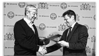
Подписание соглашения о сотрудничестве и взаимодействии между Федерацией профсоюзов Свердловской области и Свердловским творческим союзом журналистов, 23.09.2016 г.