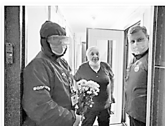
Акция «Волонтер Первая», 30.04.2020 г.