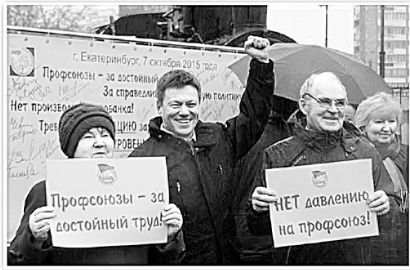
Публичная акция ФПСО в рамках Всемирного дня действий «За достойный труд!», 7.10.2015 г.