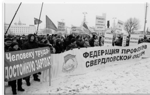
Профсоюзный митинг «За достойный труд!», 1.02.2020 г.