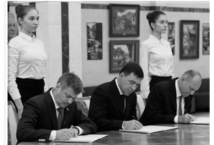
Подписание областного трехстороннего соглашения по регулированию социально-трудовых отношений между ФПСО, Правительством области, областным Союзом промышленников и предпринимателей, 1.02.2018 г.