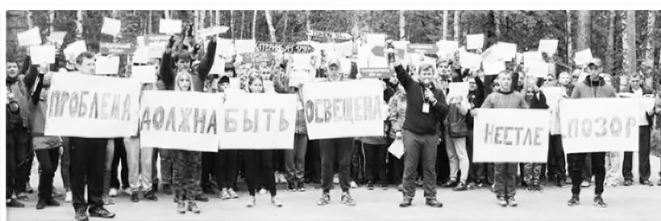
IX Уральский профсоюзный молодежный слет, 14-16.06.2019 г.