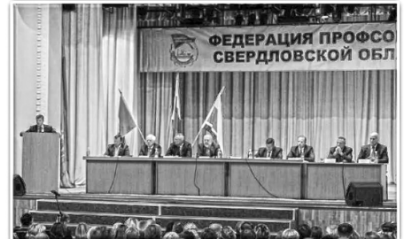
Форум профсоюзов Свердловской обл. «Человек труда в современном мире», 30.08.2016 г.