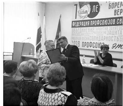
XV Слет ветеранов предприятий и организаций, посвященный 100-летию ФПСО, 27.02.2018 г.