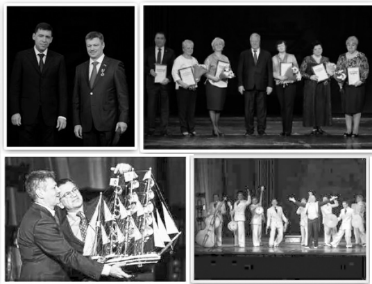
Торжественное мероприятие, посвященное 100-летию ФПСО, 1.02.2018 г.