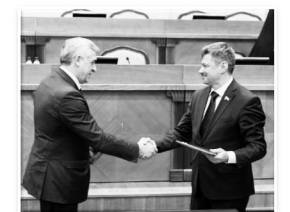
Подписание соглашения о сотрудничестве ФПСО с Уральским государственным экономическим университетом, 31.01.2018 г.