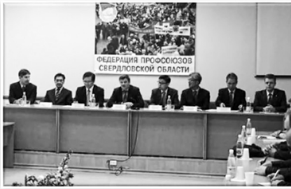
Рабочая встреча с делегацией Федерации корейских профсоюзов провинции Кенги, 30.08.2016 г.