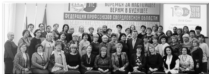
XVIII Слет профактива женщин Свердловской области, посвященный 100-летию ФПСО, 1.03.2018 г.