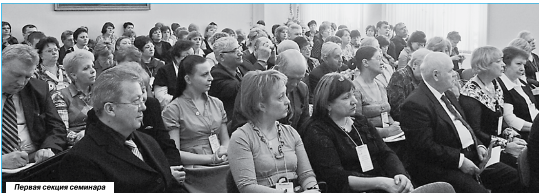
Первая секция семинара