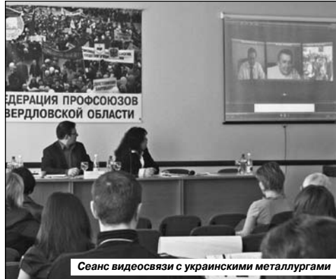
Сеанс видеосвязи с украинскими металлургами