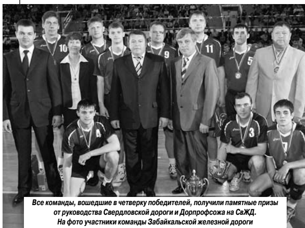
Все команды, вошедшие в четверку победителей, получили памятные призы от руководства Свердловской дороги и Дорпрофсожа на СвЖД. На фото участники команды Забайкальской железной дороги