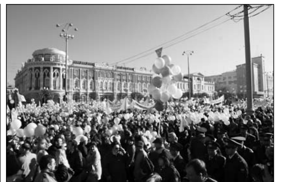
Центральная улица Екатеринбурга заполнена демонстрантами