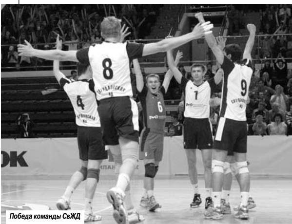
Победа команды СвЖД