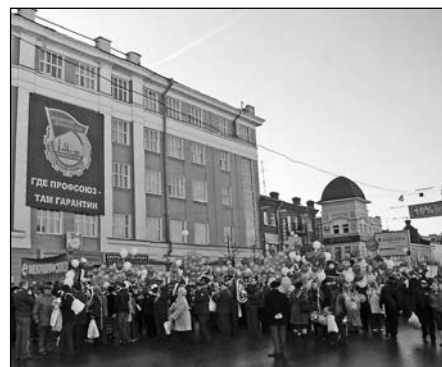
Колонны начинают формироваться здесь, у II Дома профсоюзов