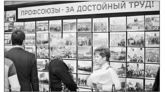
ОБЛАСТНОЕ СОБРАНИЕ. ДВОРЕЦ КУЛЬТУРЫ ЖЕЛЕЗНОДОРОЖНИКОВ.