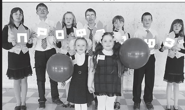
Самые маленькие участники конкурса