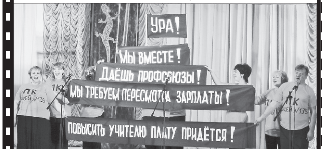
Агитбригада ПК МОУ Лицей 135