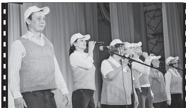
Победители Всероссийского конкурса — агитбригада ЗАО «Невьянский цементник»