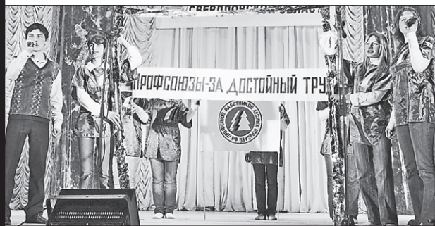
Агитбригада Талицкого лесотехникума