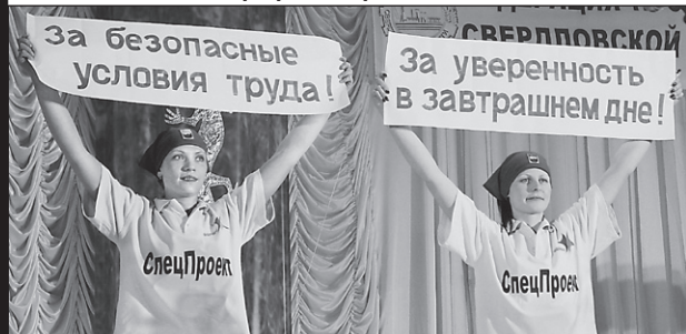
Агитбригада «Спецпроект» Серовского завода ферросплавов