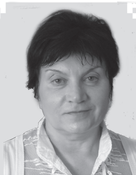
От имени областного комитета профсоюза работников лесных отраслей поздравляю членов профсоюза, профактив и ветеранов с Первомаем!

По общекомандному зачёту на I месте оказались служба внутреннего контроля, на II месте – цех ламинирования, на III месте – цех ДСП. Грамоты и подарки сопровождалось громкими аплодисментами болельщиков. Спасибо нашему профсоюзному комитету и администрации предприятия за такой добрый праздник!».