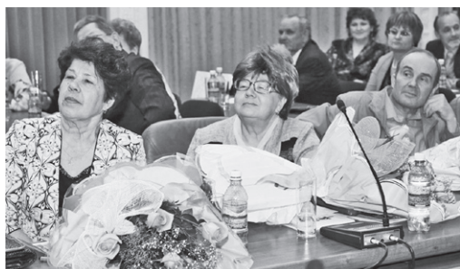
Ветераны профактива Свердловской дороги с интересом слушали выступления докладчиков