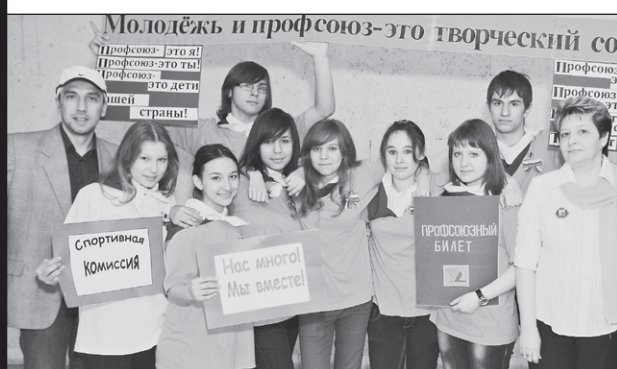
Детская агитбригада лагеря «Буревестник» обкома профсоюза работников связи

18 апреля в Екатеринбурге прошел II Всероссийский конкурс профсоюзных агитбригад «За достойный труд», посвященный 20-летию ФНПР. Уже второй раз подряд участники конкурса со всей страны гостеприимно принимала Федерация профсоюзов Свердловской области, которая в свое время и стала инициатором возрождения всероссийского движения профсоюзных агитбригад.