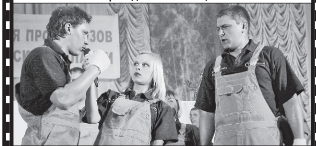
Агитбригада «Синара» профкома Синарского трубного завода