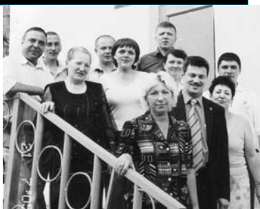
Депутат и его помощники

– Из трех сил (власти, бизнеса и трудящихся), формирующих через нормативные акты выгодные для себя правила жизни, первые две явно перетянули на себя большую часть одеяла. И то, за что не набралось голосов при одном голосовании, затем приходится исправлять внизу – в тысячах организаций – через конфликты при формировании колдоговора, через судебные решения. Значит, профсоюзам надо идти во власть и формировать удобные для наемных работников правила жизни. У профсоюзов нет права законодательной инициативы. А необходимость защищать интересы работников на законодательном уровне есть. Значит, надо вводить в депутатский корпус, туда, где форми-