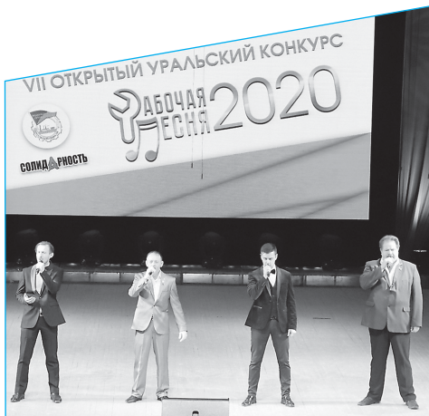
Звучит гимн ФНПР в исполнении лауреатов прошлых лет

Конкурс закончился. И уже началась подготовка к следующему!