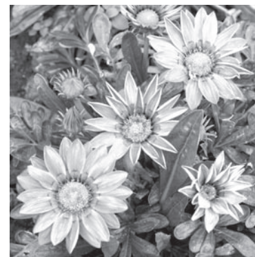
Автор – Оксана МАХАЛОВА