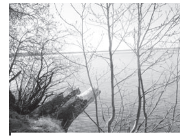
Автор – Ирина КРОВОТА