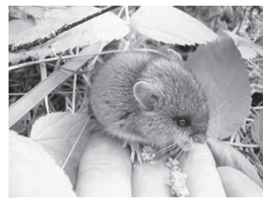
Автор – Ирина ПАШНИНА