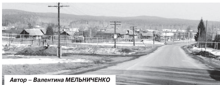
Автор – Валентина МЕЛЬНИЧЕНКО