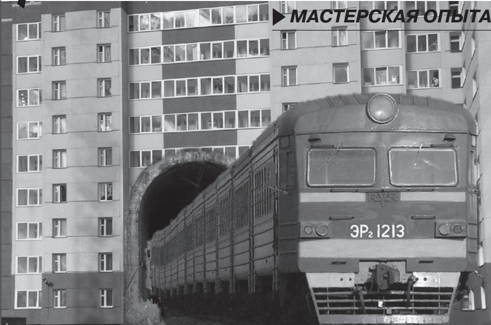
▶ МАСТЕРСКАЯ ОПЫТА

Уже год действует постановление профсоюза, согласно которому освобожденные от основной работы председатели первичек, оформляя ипотеку, могут претендовать на корпоративную поддержку в не меньшей степени, чем любой другой работающий на магистрали железнодорожник.