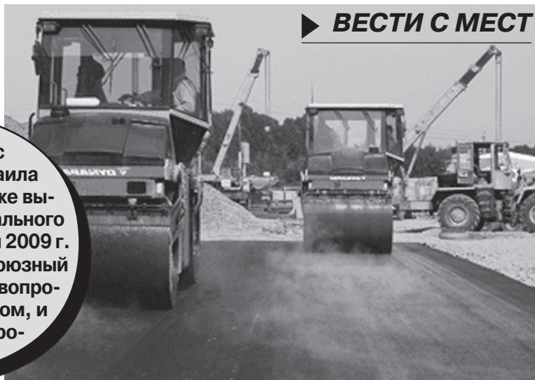
► ВЕСТИ С МЕСТ