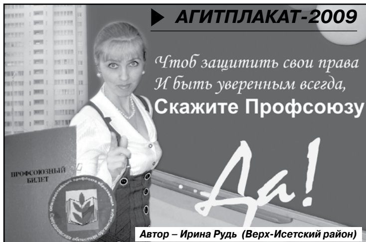
Автор – Ирина Рудь (Верх-Исетский район)

Свердловская организация профсоюза работников народного образования и науки провела областной конкурс на лучший профсоюзный агитационный плакат. Конкурс проводился в целях пропаганды деятельности профсоюза по защите прав и интересов работников и студентов образовательных учреждений, усилению мотивации профсоюзного членства. Кроме того, он стал своего рода первым этапом в рамках аналогичного конкурса, объявленного Федерацией профсоюзов Свердловской области, куда будут представлены лучшие в отрасли работы.