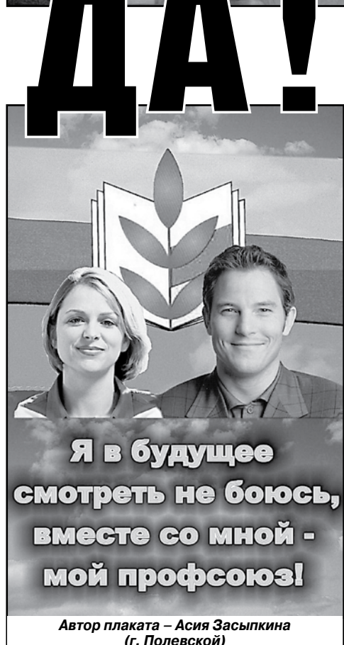
Автор плаката – Асия Засыпкина (г. Полевской)