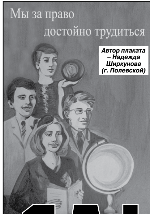
Автор плаката – Надежда Ширкунова (г. Полевской)