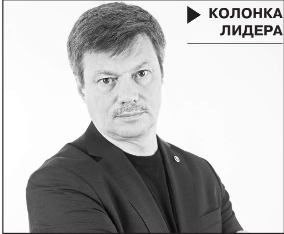
▶ КОЛОНКА ЛИДЕРА

Из выступления на Межрегиональном информационном семинаре 11 июля 2017 г.